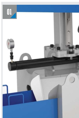
ГИДРАВЛИЧЕСКИЙ ЗАЖИМ ЗАГОТОВКИ